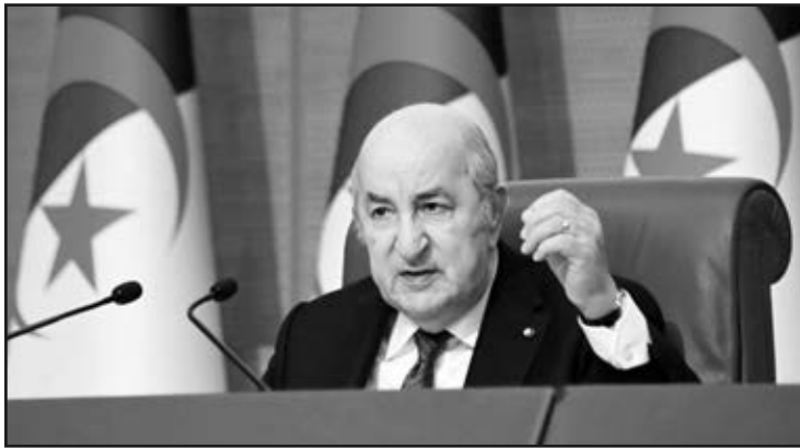
سيدشن "العرباوي" خلال هذه الزيارة، مركز إنتاج الغاز «حاسي باحمو».

دعا "عبد المجيد تبون"، رئيس الجمهورية، إلى أهمية الحفاظ على وحدة الصف في عالم مضطرب لمواجهة مختلف التحديات، لاسيما والاتحاد شكّل محطة حاسمة في نضال الشعب الجزائري لاستعادة هويته من الاستعمار.